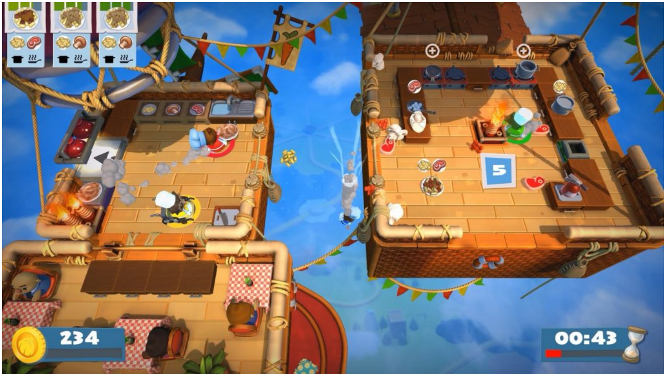
Secuencia del juego «Overcooked».

Pero, aunque sea una afición más común entre los jóvenes, hay títulos para todas las edades: niños, mayores, o incluso, la familia al completo, pueden disfrutar de juegos con los que compartir tiempo en común y divertirse sin necesidad de salir de casa.